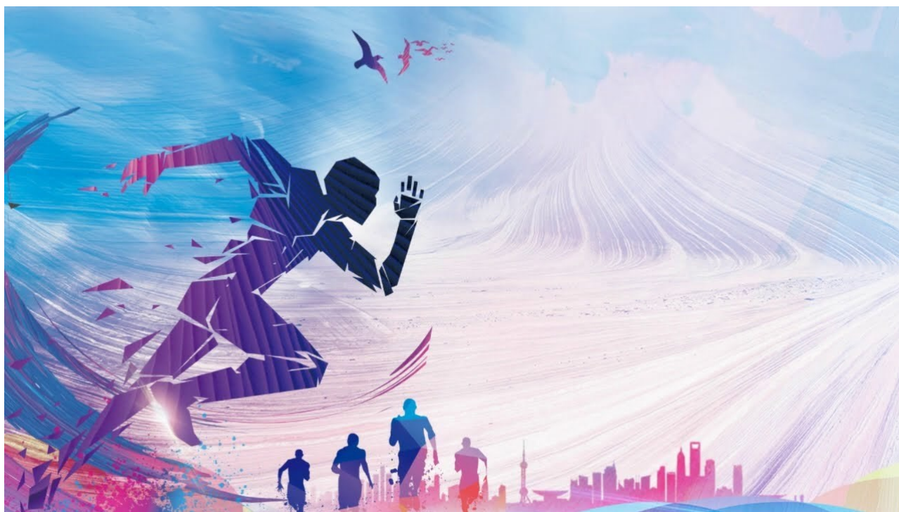
Рис.1. Бегущий спортсмен

Результаты анализа литературных источников свидетельствуют о том, что величина переноса тренированности и его направленность зависят от особенностей всех структурных элементов (Рис.1).